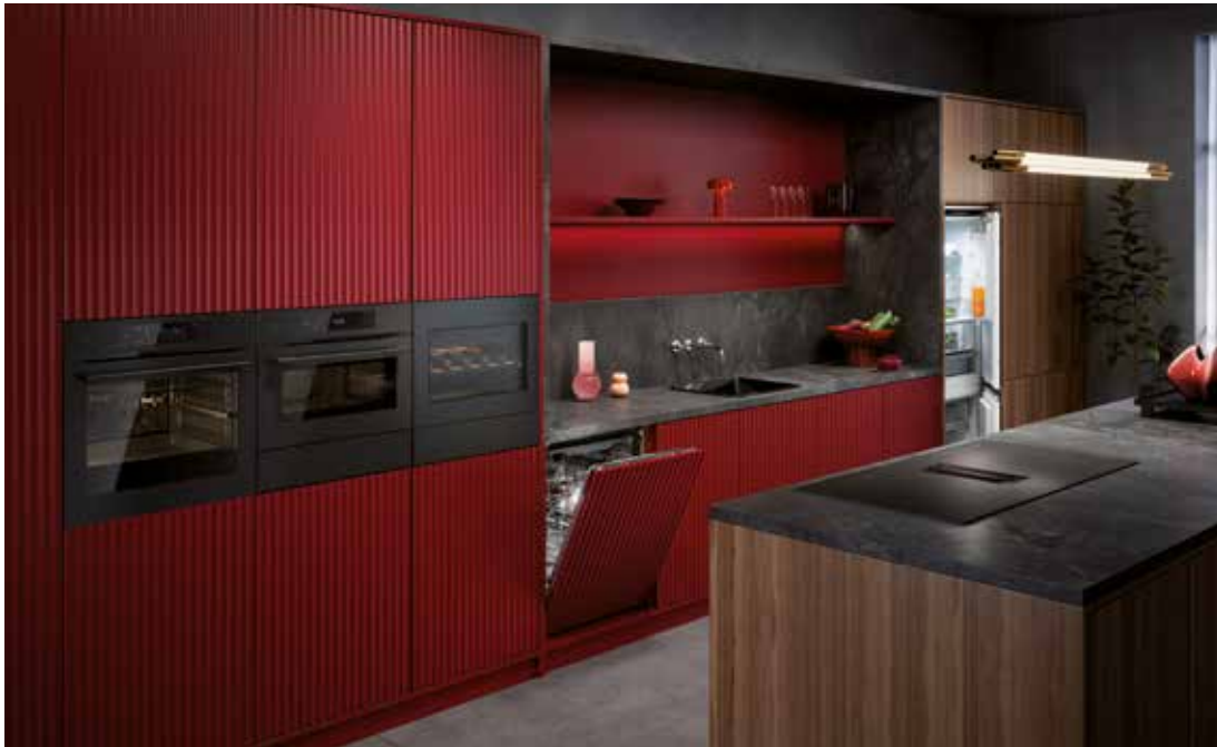
Die neue AEG Küchenlinie zeigt sich in einem markanten, aber zugleich dezenten und zeitlosen Design.

Nach der Präsentation der wegweisenden SaphirMatt Induktionskochfelder im vergangenen Jahr nutzt AEG die IFA 2024 für die bedeutendste Produkteinführung in der Geschichte der Marke. Die neue AEG Küchenlinie verbindet smarte Technologie für KI-unterstütztes Kochen mit markantem Design und deutlich verbesserter Energieeffizienz. Vorgestellt werden Einbaulösungen in jeder Produktkategorie, darunter Öfen, Kochfelder, Dunstabzugshauben, Geschirrspüler sowie Kühl- und Gefriergeräte.