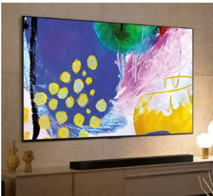
Das Gallery Design der G2-Serie macht es möglich, den Fernseher wie ein Bild bündig an der Wand anzubringen.

Als Premium-Produkte sind die neuen OLED-TVs von LG sehr gut ausgestat-