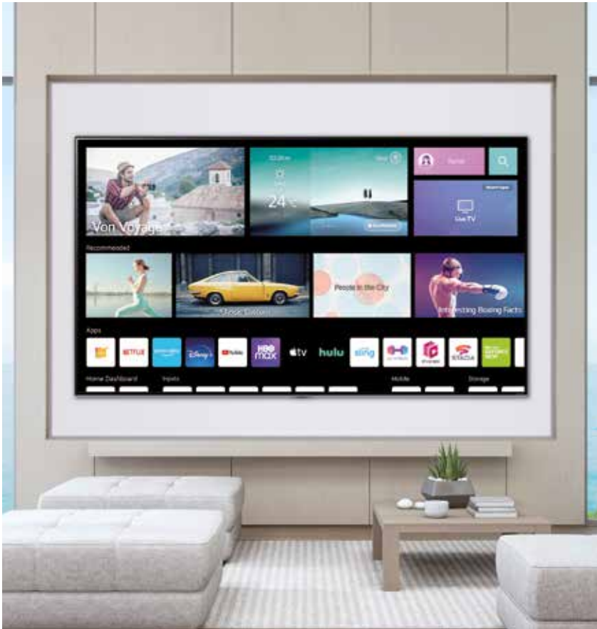
Die neue Produktgeneration basiert auf der weiter verbesserten Smart TV-Plattform webOS 2.2.

(UVP 48 Zoll) und 2.599 Euro (UVP 65 Zoll). Beide OLED-Serien sind mit dem Alpha 7 Gen5-Prozessor mit